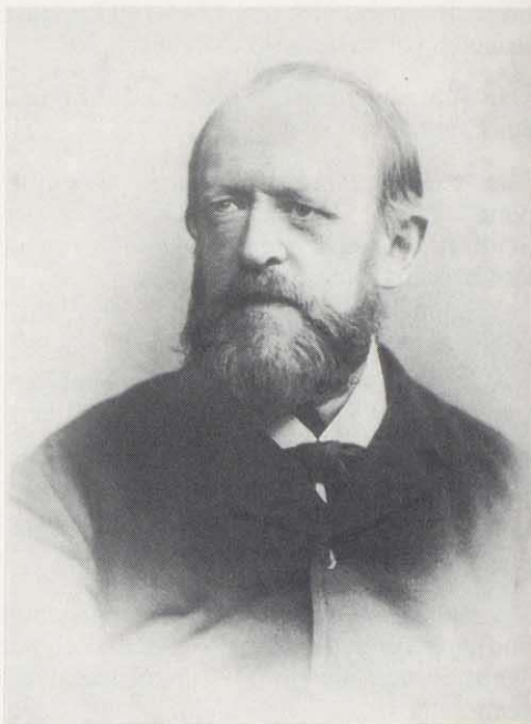
Fedor Streit (1820 – 1904), (Staatsarchiv Coburg, Bildsammlung I, 494)

25. April 1848 Bei der entscheidenden Versammlung der Wahlmänner zur Wahl eines Abgeordneten in die Nationalversammlung im Coburger Rathaus tritt er als Wahlmann für Sonnefeld offen für die Republik als Staatsform und vor allem für Joseph Meyer, den Chef des Bibliographischen Instituts in Hildburghausen, als Coburger Kandidaten für die Paulskirche ein. Bekanntlich wird der nationalliberale Moriz Briegleb als Abgeordneter der Deutschen Nationalversammlung gewählt.