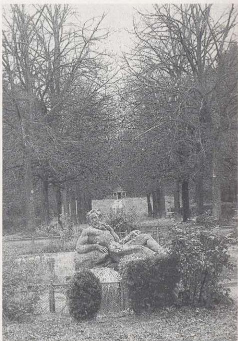
Neptunbassin als zentrales Element in der Achse