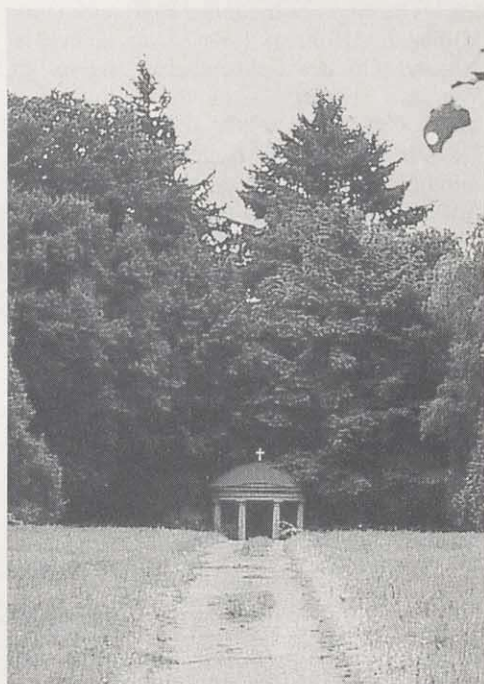
Mausoleum im Osten des Parks

Zur Zeit der Anlage des Parkes teilte sich der Weg und verlief zu beiden Seiten der Wiesenflächen unter einer Lindenreihe. Diese bilden heute die Kante des Waldes. Die geometrische Ordnung wird auf diese Weise langsam aufgelöst, bevor der Park gänzlich in Wald übergeht.