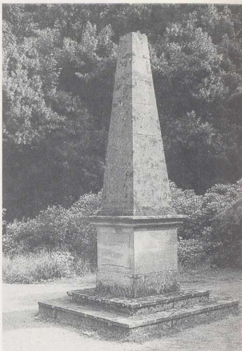
Obelisk im Rondell

Der größte Platz als Mittelpunkt des Parkes, etwa in der Mitte zwischen Haupteingang und Mausoleum, ist mit einem Wasserbassin ausgestattet, in dem die Figur des Neptun, ein weiteres Werk von Carlo Müller, thront. Leider ist das Becken heute nicht mehr mit Wasser gefüllt, es bedarf dringender Ausbesserungsarbeiten, da die Innenwände