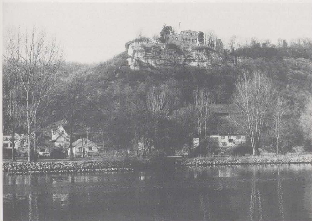
Die Karlbürg von Osten gesehen.

Allein die historischen Nachrichten kennzeichnen so Karlbürg bereits als einen wich-