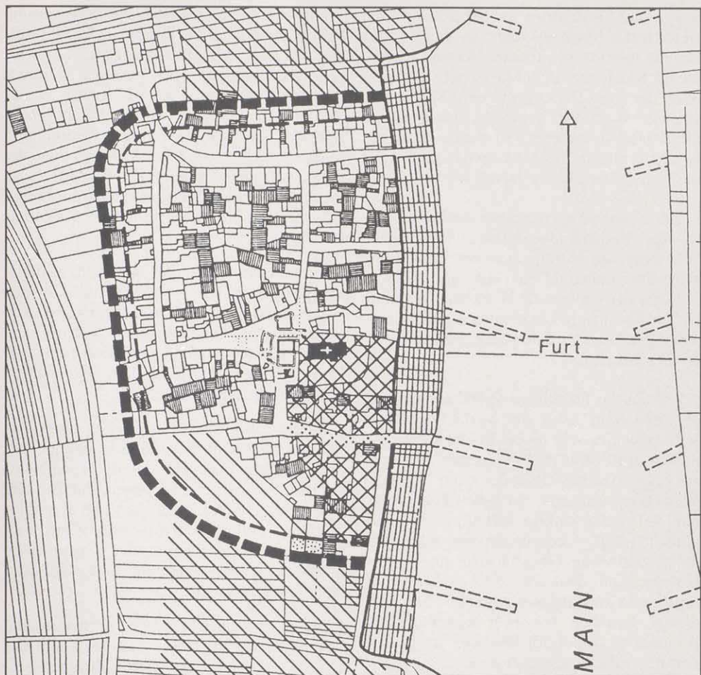
Zentrum der Talsiedlung Karlbург mit Bereich des Marienklosters (Kreuzschraffur), Schiffslände und Befestigung des 10. Jahrhunderts.

Königshöfen bzw. Pfalzen der karolingischen, insbesondere ottonischen Zeit, erlaubt.