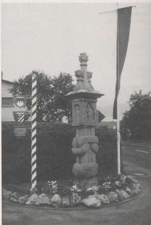
Die Gemeinde Oberstreu im Landkreis Rhön-Grabfeld besitzt einen der ältesten Bildstöcke Frankens. Er wurde vor 550 Jahren errichtet.

Das im Volksmund „Franzosenbildstock“ genannte Flurdenkmal steht am Nordausgang Oberstreus, in der Antoniusstraße. Es gilt laut dem 1921 erschienenen Kunstdenkmälerband des Bezirks Mellrichstadt nicht nur als eines der originellsten seiner Art in Unterfranken, sondern auch als eine der ältesten Stifungen Frankens. Der unterfränkische Bezirksheimatpfleger Dr. Reinhard Worschech bemerkt zu diesem Flurdenkmal, die Martersäule von Oberstreu zähle zu den merkwürdigsten, aber auch schönsten Bildstöcken in Unterfranken. Der Fuß des aus grünem Schilfsandstein mit hoher Festigkeit bestehenden Bildstocks ist romanisch und besteht aus vier Knotensäulen, die im unteren Teil mit verschlungenem Flechtwerk versehen sind. Die Wustkapitelle haben Diamantverzierung. Der Bildstock stammt von 1448. Der gotische Aufsatz wurde etwa 150 Jahre später, im Jahre 1591 oder 1597, angefertigt. Er ist als Deckel des hohlen Gehäuses gebildet und endet in drei Fialen mit Kreuzblumen. Die Höhe des Bildstocks ist 3,70 m.