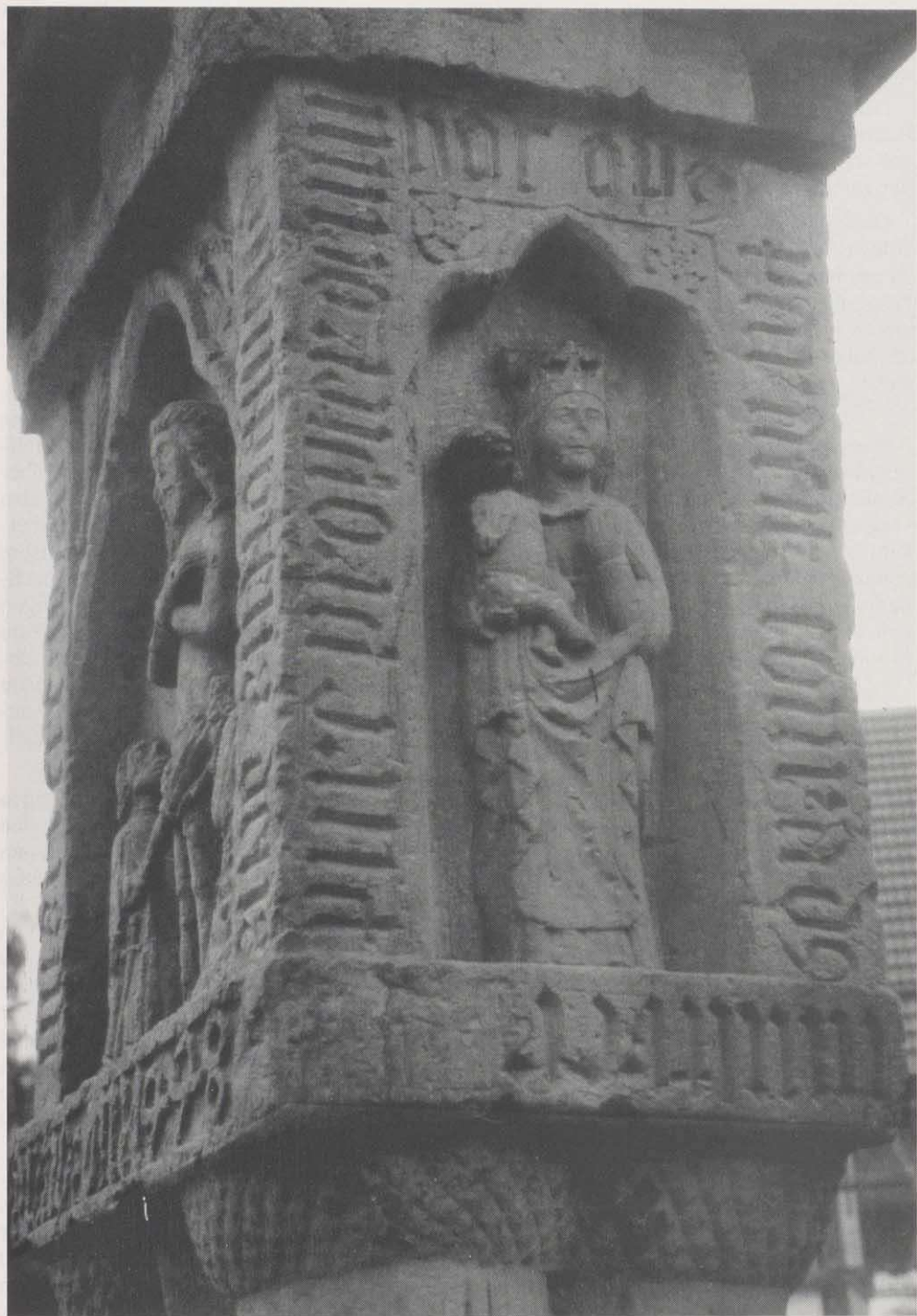
Das kubische Gehäuse des Oberstreuer Bildstock zeigt vier Reliefs. In spätgotischen Minuskeln berichtet eine lateinische Inschrift u.a. „...Dieses Werk hat vollendet Konrad Multerer wegen Gott .....“