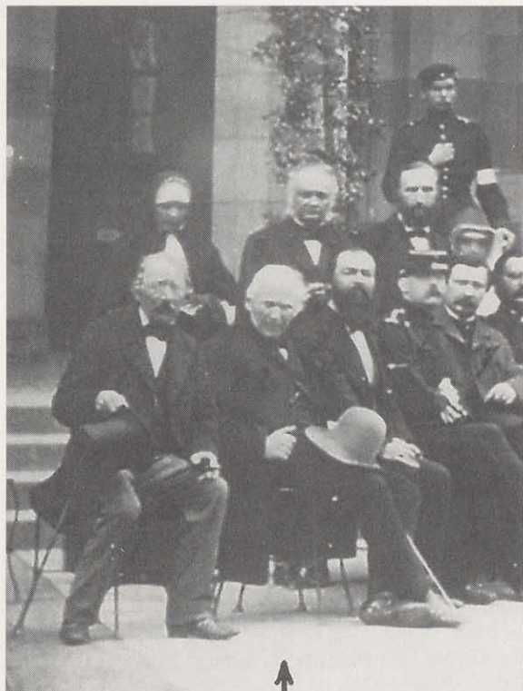
Kissingen Ärzte. Ausschnitt aus einem Foto 1866

phäre ... In den besseren Ortschaften herrscht mehr Reinlichkeit vor, aber der Sinn dafür ist überhaupt in der hiesigen Bevölkerung nicht sehr entwickelt. Neigung zum Baden fehlt im Bezirke gänzlich ... Die Stubenböden ... öfters nicht einmal mit Brettern sondern nur mit Lehm bedeckt, finster, angeraucht, dumpf, feucht, so daß sich Betten, Kleider und Wäsche bei feuchter, kalter Witterung mit Schimmel beschlagen ... der oft nothwendige Aufenthalt von jungem Feder- und anderem Vieh, junge Hühner, Gänse, ja selbst Schweine in den Zimmern, wodurch oft neben Unflath und Nässe der widerlichste Geruch in einem solchen Zimmer sich bildet.“ Wenn dies auch vorwiegend Schilderungen aus dem ländlichen Bereich eines armen Bezirkes sind, so dürften die Verhältnisse in anderen Gegenden sich nicht wesentlich unterscheiden haben. Diese Physikatsberichte werden zur Zeit von Herrn Werner Eberth, Bad Kissingen bearbeitet und noch 1999 publiziert.