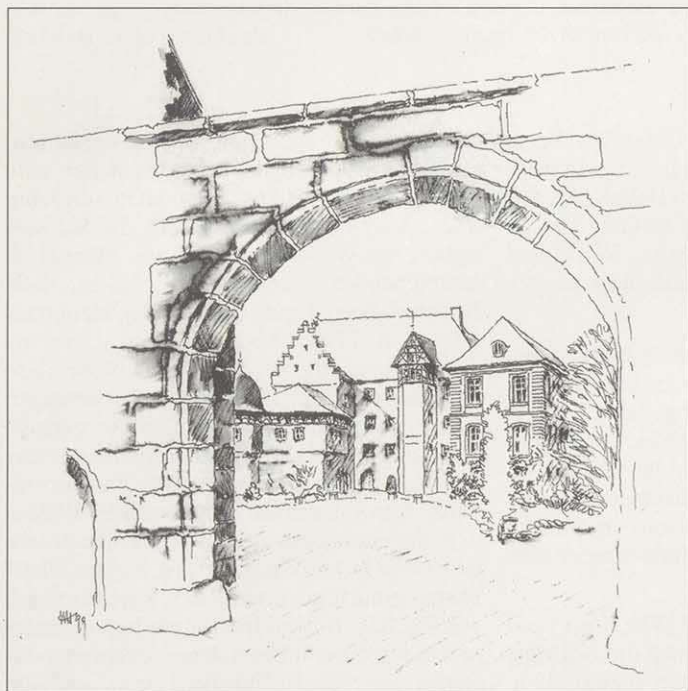
Eyrichshof, Stadt Ebern, Landkreis Haßberge: Schloß, Stammsitz der Freiherren von Rotenhan im Baunachgrund