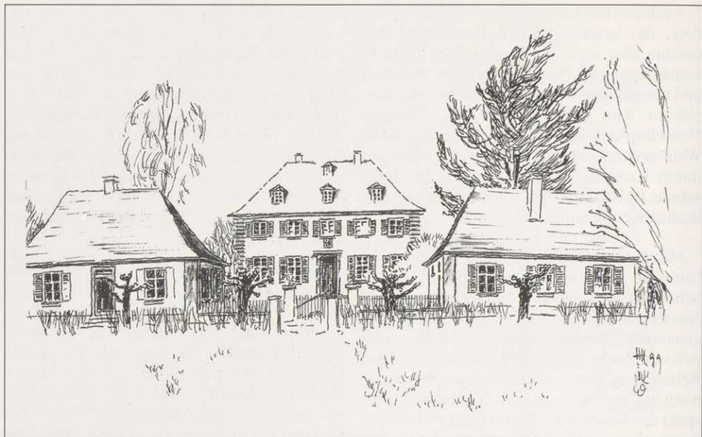
Wald (Stadt Gunzenhausen) Schloß: Neubau 1730 als Zochas ländlicher Wohnsitz. Schlichter, aber durch seine Proportionen auch im Verhältnis zu den Nebengebäuden und zum Garten ein sehr ansprechender Bau Zeichnung: H. H. Hofmann

vorhanden, deren Umsetzung unter Zocha aber nur langsam gedieh. Es könnte daher sein, daß Retty dazu ausersehen war, diese Zochaschen Pläne in Ludwigsburger Manier zu verwirklichen. Nachdem der Ludwigsburger Formenkanon im ganzen Ansbacher Fürstentum nicht zu finden ist und Rettys Bauten manchmal kaum von denen Zochas zu unterscheiden sind, kann nur gefolgert werden, daß Retty sich Zochas stilistische Neuerungen zu eigen machte und mit gewissen individuellen Abwandlungen weiterführte, wie er auch die Planungen des nicht verschwundenen, sondern in der markgräflichen Regierung stets präsenten Vorgängers im wesentlichen beibehielt.