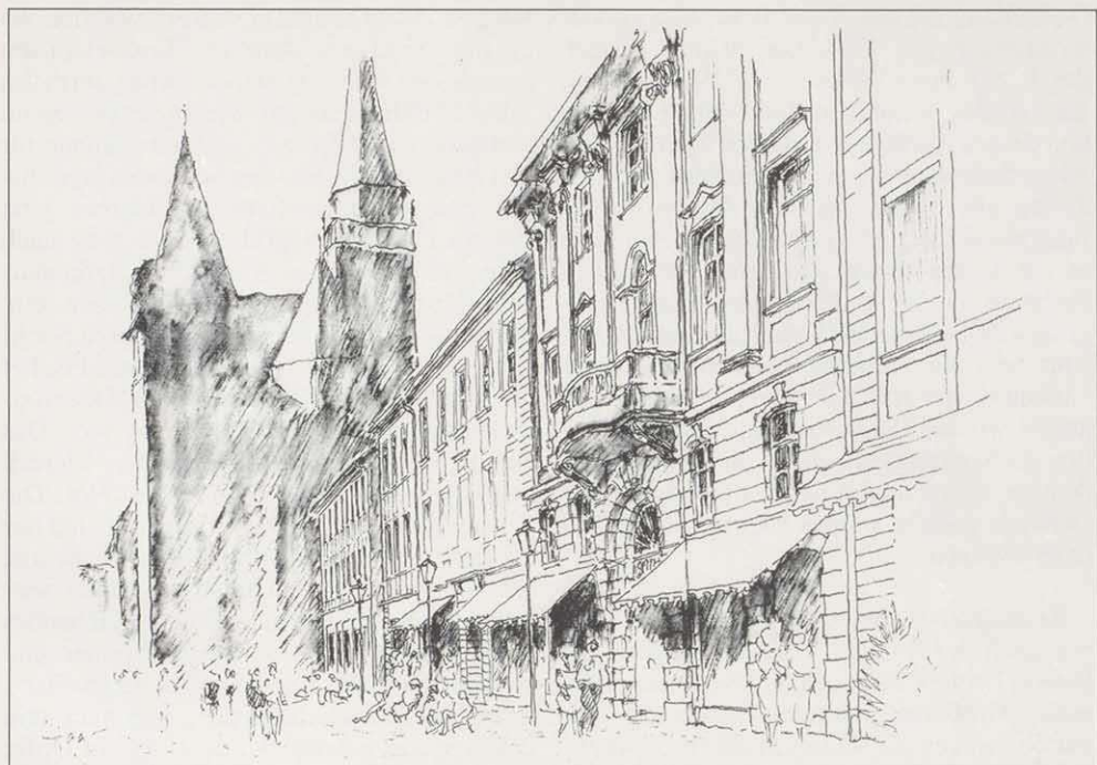
Ansbach, Martin-Luther-Platz 2, 4, 8, 10: Nach dem Stadtbrand von 1719 erhielt Zocha die Gelegenheit, den ganzen Baublock zwischen Martin-Luther-Platz und Pfarrstraße neu zu gestalten und dabei seine architektonischen und städtebaulichen Vorstellungen, die ganz denen des Fürstenhauses entsprachen, zu realisieren. Haus Nr. 6 wurde von Gabrieli erbaut. Zochas Zurückhaltung gegenüber dem Gabrieli-Bau ist bemerkenswert und kann als beispielhaft gelten.

ersten amtlichen Einsatz. Unter bis heute noch nicht geklärten Umständen errichtete aber das Herzstück des neuen Baublocks, das Gasthaus zur Sonne, Gabriel de Gabrieli von Eichstätt aus. Zochas ureigenes Werk sind dagegen die an die Stadtmauer angelehnten Palais an der Pfarrstraße.