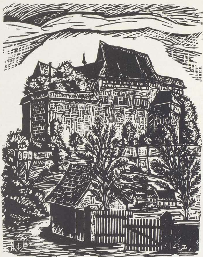
Die Cadolzburg vor ihrer Zerstörung

Zunächst war es ein harter Schlag für ihn, zu erfahren und zu sehen, was aus der Cadolzburg geworden ist – eine Ruine. Seinem unermüdlichen Einsatz vor allem ist es zu danken, daß die Cadolzburg vor dem Verfall, dem sie nach dem Brand am 17. April 1945 preisgegeben war, wieder aufgebaut wurde. Inzwischen ist dies zu zwei Dritteln geschehen. Es wird wohl noch zwei bis drei Jahre dauern, bis das Werk vollendet ist.