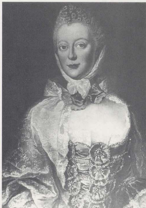
Herzogin Elisabeth Friederike Sophie (1732–1780) Unbekannter Maler, um 1763

Um zu erklären, warum diese als noch junge Frau und Herzogin von Württemberg ausgerechnet Donndorf zu ihrem Lieblingssitz machte, müssen wir ihre Lebensge-