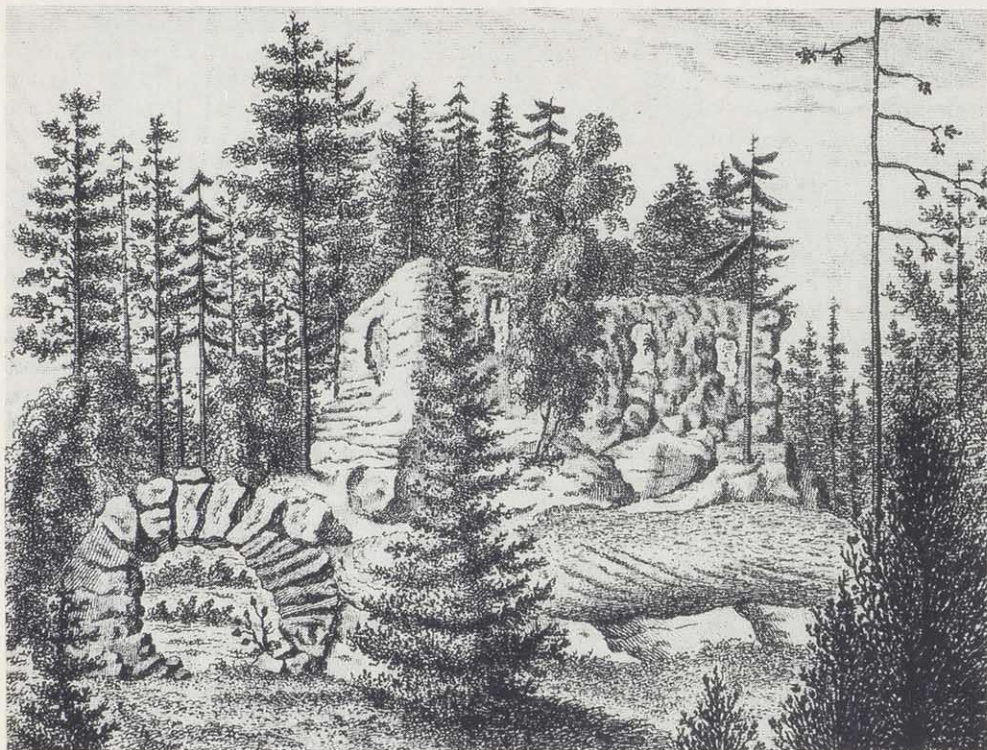
Die Kapelle im Holze als Ruine (J. C. E. v. Reiche 1795)

Buchen. Eine Allee mit Kastanienbäumen wurde angelegt. 1791 konnte man bei einer Versteigerung feststellen, daß man für Fantaisie über hundert Pflanzen nordamerikanischer Herkunft erworben hatte. Ein Herzstück des Friederikeparks war der Rosengarten. Es versteht sich aber von selbst, daß Rabatten mit anderen Blumen nicht fehlten. Aus Böhmen und aus Stuttgart bezog man Rebstöcke. Der „Weinberg“ am Hanggarten und Rebstöcke in den Zwickeln der Kaskade erinnerten an Sanssouci und waren vielleicht sogar eine bewußte, wenn auch bescheidene Nachahmung.