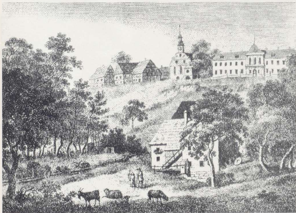
Schloß Fantaisie und Lüchauschloß mit Türmchen am Ende des 18. Jahrhunderts. Repro aus der „Oberfränkischen Heimat“ 1931. Verbleib des Originals unbekannt.