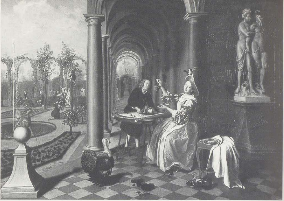
Peter Jacob Horemans, Dame im Garten, Öl auf Leinwand, um 1750.