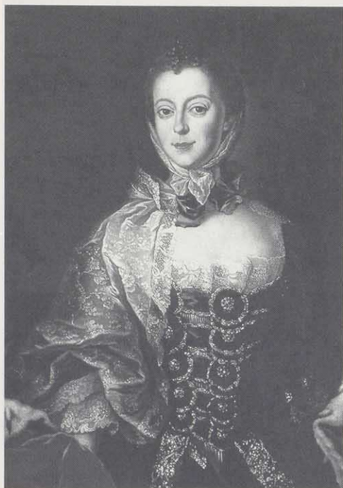
Anna Rosina Lisiewska, Herzogin Elisabeth Friederike Sophie von Württemberg, Öl auf Leinwand, um 1750