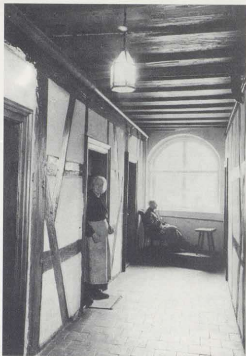
Im 1. Stock des Spitals (Foto 1955)

Ausstellung und die begleitenden Texte studiert hat, dem bietet sich vor der Tür des Ausstellungsraumes sofort die praktische Anschauung: Der einzigartige Spitalhof mit dem Pfründnerhaus und dem wunderschönen Fachwerk der Wirtschaftsgebäude, die verträumte Kirchenruine mit dem Grab des Stifterpaares. Bei Gruppenführungen besteht zudem Gelegenheit, auch den Spitalgarten und das Innere des Hauses mit dem Kleinod der Hauskapelle kennen zu lernen. Eine historische Kurzinformation, die vom Stadtarchiv herausgegeben wurde, ermöglicht es den Besucherinnen und Besuchern auch, etwas über die Geschichte und Bedeutung der einzelnen Gebäude zu erfahren und ihre Details mit Inschriften, Jahreszahlen, Reliefs und den eigenartigen „Wetzrillen“ zu entdecken.