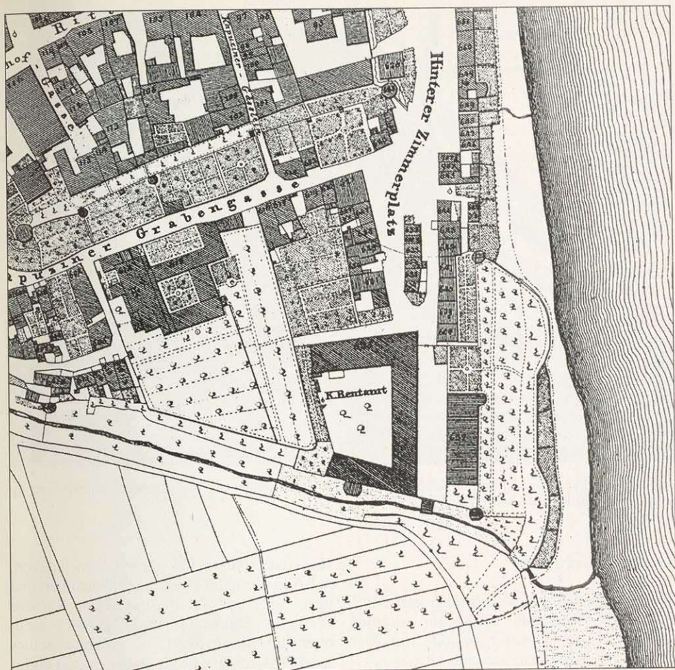
Abb. 3: Das 1825 aufgenommene Katasterblatt Kitzingen (hier ein Ausschnitt) ist für die Bausubstanz der Stadt während des 18. Jahrhunderts repräsentativ. Die Dreiflügelanlage der ehemaligen Kaserne erscheint hier bereits als Königlich Bayerisches Rentamt. Kartengrundlage: Uraufnahme 1:2500 (Stadtblatt Kitzingen), v. J. 1825

Sitz des Amtskellers und wurde zusätzlich als Ergänzung der gegenüberliegenden Zehntscheuer benutzt. Die im Ostflügel befindlichen „Fruchtsäle“ konnten 20000 Malter aufnehmen. 37)