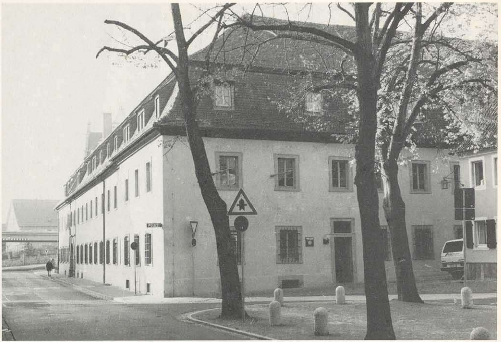
Abb. 4: Die ehemalige Kitzinger Kaserne als Sitz der Dienststelle der bayerischen Landespolizei im Jahre 1997.