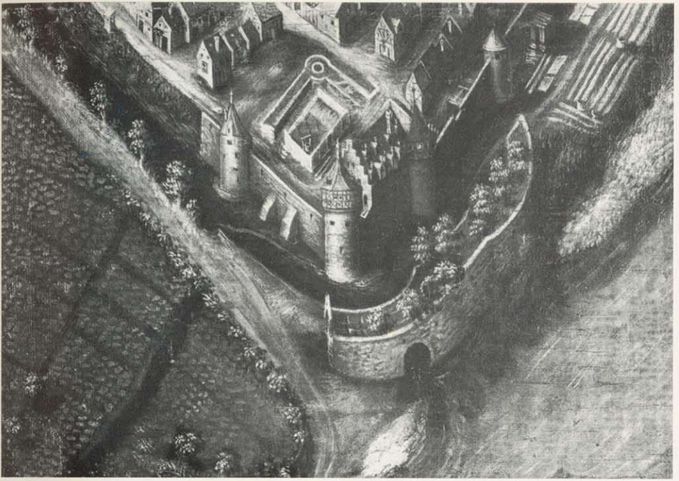
Abb. 1: Ausschnitt aus der „Ansicht der fürstl. brandenburgischen Hauptstadt Kitzingen 1628“. Der spätere Bauplatz der Kaserne zu Kitzingen erscheint hier noch als Baumgarten gegenüber der Zehntscheuer mit Treppengiebel. (Staatsarchiv Würzburg, Würzburger Risse und Pläne II/3)

Im April 1724 verhandelt Neumann wegen der Flößung von Bauholz (möglicherweise für den Dachstuhl) von Wiesentheid nach Kitzingen. 11) Wenig später berichten Stadtvogt und Gegenschreiber von Kitzingen, „daß die alldaßige Paraquen Unkosten Berechnung sich auf 11000 fl. von 1722 bis 1724 belaufen“. Eine deutliche Überschreitung der Kostenvoranschläge, in diesem Falle von ursprünglich 7222 Reichstalern, war also auch schon im Barock üblich.