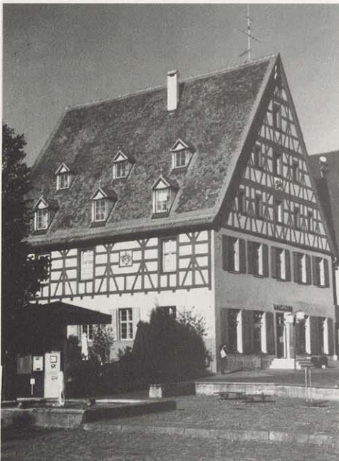
Haus des Oberamtmanns am Marktplatz. Im 15. Jahrhundert wird Schwabach zu einem Verwaltungsmittelpunkt im ansbacher Markgrafentum.

Zwei Kirchen, die Spitalkirche und die Stadtkirche, dokumentieren die Aufwärtsentwicklung. Mit der Zeit war die Stadt so angewachsen, daß man für die Versorgung der Alten und Kranken eine eigene Einrichtung benötigte. 1375 erfolgte daher mit Unterstützung der Nürnberger Familie Glockengießer die Gründung eines eigenen Spitals. Knapp ein Jahrhundert später, 1469, brach man die erst gut 50 Jahre vorher erweiterte Stadtkirche ab und errichtete an ihrer Stelle in fast 30 Jahren einen neuen, deutlich größeren Bau.