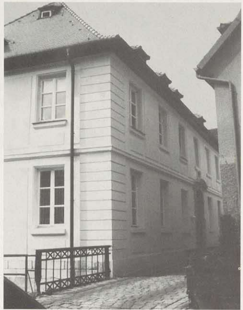
Münzgebäude. Münzen wurden in Schwabach von der Mitte des 15. bis Ende des 18. Jahrhunderts geprägt.

Über ihre Grenzen hinaus gewann die Stadt Schwabach an Bedeutung auch durch die Reformation, die, obwohl von der örtlichen Obrigkeit stark gefördert, zunächst eine Volksbewegung gewesen ist. Sie war neben den rein religiösen Aspekten auch ein Protest gegen den hiesigen Klerus. Durchsetzen konnte sich die Reformation jedoch erst, als mit der alleinigen Regierungsübernahme durch Markgraf Georg