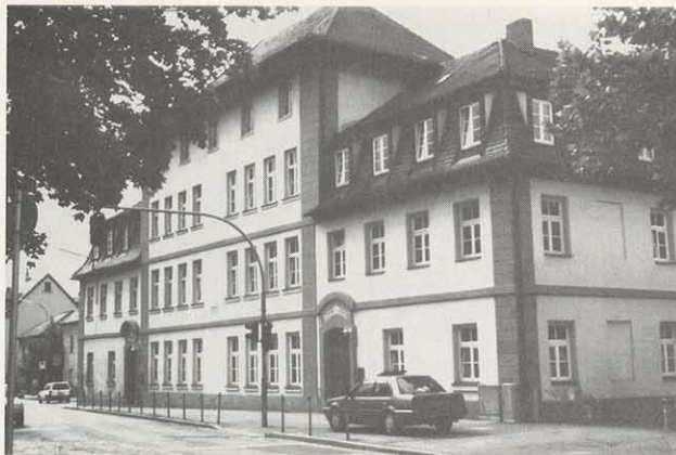
Ehemalige markgräfliche Kattunfabrik, Geburtshaus des Klaviervirtuosen, Komponisten und Musikpädagogen Adolph von Henselt, später Kaserne und Schule.