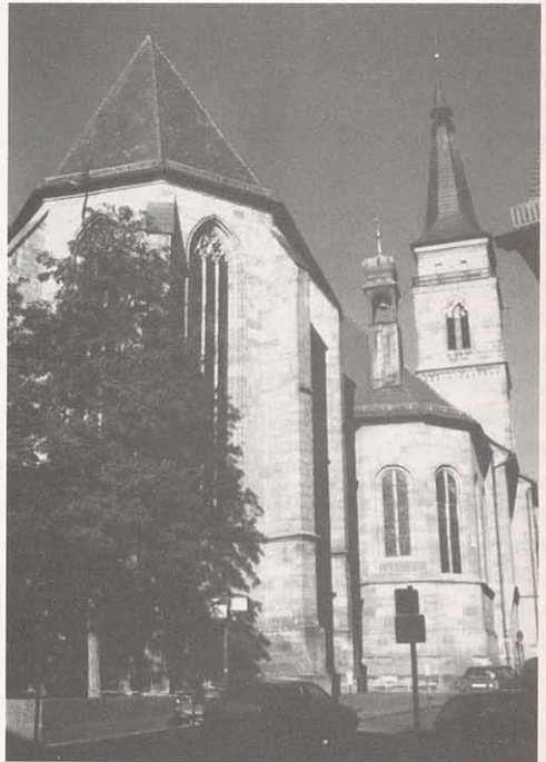
Reichhaltig mit Kunstschätzen ausgestattet ist die 1469 bis 1495 errichtete Stadtkirche. Besonders bedeutend ist der Hochaltar aus der Werkstatt von Michael Wohlgemut. Vermutlich hat auch Veit Stoß daran mitgewirkt.