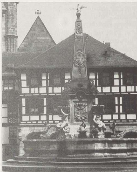
Rathaus, davor der barocke Schöne Brunnen

Über längere Zeit blieb Schwabach Reichsgut, bis es im 12./13. Jahrhundert in den Besitz des Zisterzienserklosters Ebrach gelangte und dabei etwas von seiner zentralen Funktion einbüßte. Das Kloster behielt umfangreiche Rechte, selbst als das Dorf Ende des 13. Jahrhunderts wieder an das Reich zurückfiel. Dazu gehörte beispielsweise das Präsentationsrecht für die Geistlichen, das formal auch noch nach der Reformation, bis zur Säkularisation des