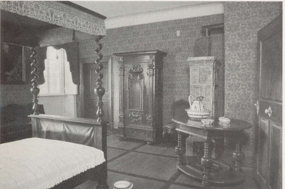
Original eingerichtetes Schlafzimmer des Fürsten Bismarck in der Oberen Saline Bad Kissingen.