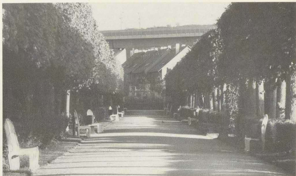
Abb. 2: Endpunkt der „Lindenallee“ mit dem um sechs Stufen erhöhten Podest der „Seebühne“ und einem Schmiedegitter als durchsichtige Gartengrenze. Der perspektivische Blick in das Flußtal ist durch eine Reihenhaussiedlung verstellt, die hoch über das Tal führende massive ICE- Brücke zerschneidet die Konturen der sanft geschwungenen Hügelketten.