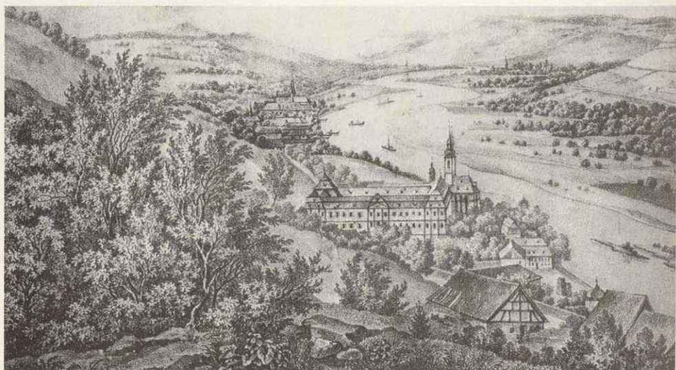
Abb. 1: Blick über das Maintal nach Westen mit dem Kloster Oberzell, der Dorfkirche von Zell (mit Dachreiter), dem Kloster Unterzell, Zellingen (linksmainisch), und Veitshöchheim (rechtsmainisch). Die Lithographie (29,2 x 21,4cm) nach einer Zeichnung von Franz Leinecker zeigt, daß vor 150 Jahren eine Sichtverbindung vom ehemaligen Lustgarten der Würzburger Fürstbischöfe in Veitshöchheim über die Auenlandschaft des Mainflusses hinweg zum Kloster Oberzell bestand.

Allerdings fällt auf, daß ausgerechnet die prächtigen Klostergebäude (Balthasar Neumann 1744–60) nicht korrekt dargestellt sind;