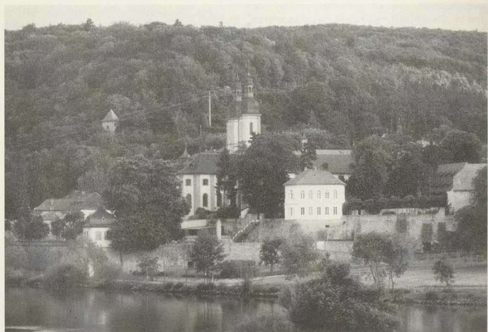
Abb. 3: Der ursprünglich Point de vue der Hauptachse des Veitshöchheimer Lustgartens: die auf einer Terrasse über dem Main gelegene Klosteranlage Oberzell.