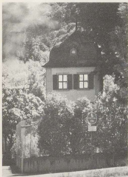
Abb. 4: Der Gartenpavillon aus dem 18. Jh. des Kolsters Oberzell, auf den die Achse der Lindenallee ausgerichtet ist. Seine unter der schön geschwungenen Schieferhaube wie Augen zur Flußaue hin angeordneten Fenster schauen heute vergeblich nach dem Rokokogarten aus.

Doch nicht nur höfisch theatralische Lustbarkeit ist bei der wahrscheinlich von Johann Prokop Meier entworfenen und unter dem Fürstbischof Adam Friedrich von Seinsheim 1763–68 vollendeten bedeutendsten deutschen Rokoko-Gartenanlage mit im Spiel. Mit dem Blick auf den in weiter Ferne auftauchenden Point de vue wird die unberührte Mainaue in den wie ein Kabinett gestalteten, hermetisch von der Außenwelt abgeschlossenen Kunst-Garten einbezogen. Das ist ein Novum in einer Gartenanlage des 18. Jahrhunderts: Eine malerische Sichtverbindung über eine Distanz von 3,3 km hinweg unter Einbeziehung einer naturbelassenen Landschaft ist Kennzeichen eines neuen Stils, dem der romantischen Landschaftsgärten. (Abb. 3)