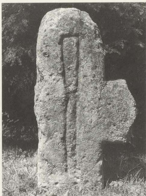
Abb. 1: Das aus Sandstein gefertigte spätmittelalterliche Steinkreuz neben der Sinnbrücke in Bad Brückenau ist 75 cm hoch, bis zu 43 cm breit und bis zu 20 cm dick. Sein Zeichen, eine Glasmacherpfeife, ist 54 cm lang.