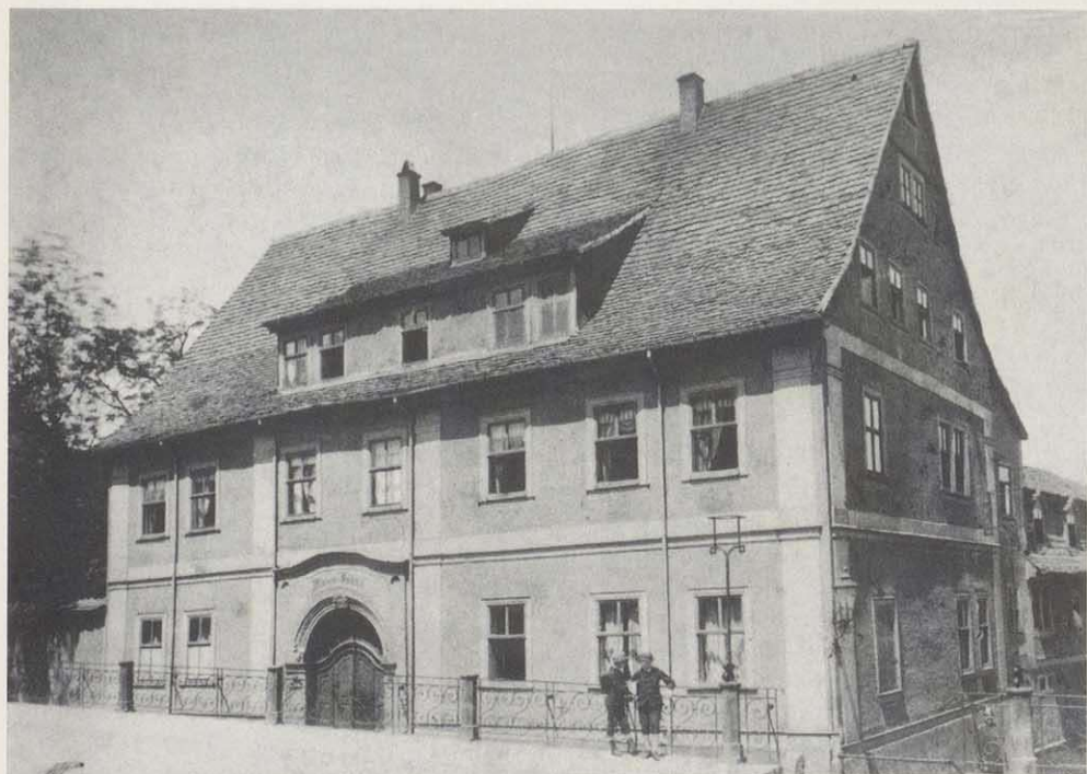
Marien-Institut in Gotha (1836–1944; Zerstörung durch Luftangriff).