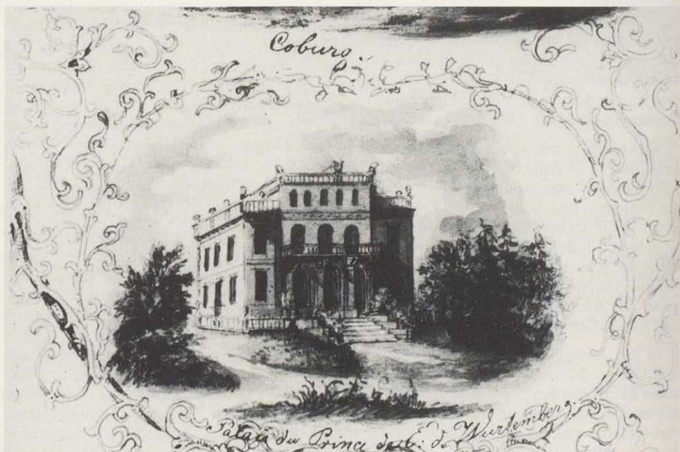
Palais Herzog Ernsts von Württemberg, heute Medauschule.

Als am 3. Mai 1842 Erbprinz Ernst Prinzessin Alexandrine von Baden heiratete, machte sie beiden Jungvermählten keine der üblichen Geschenke, sondern übergab dem Magistrat der Stadt Coburg „ein besonderes Juwel“, nämlich 2000 Taler zur Stiftung einer „Bewahranstalt für kleine Kinder hiesiger Stadt“, die ohne Unterbrechung bis auf den