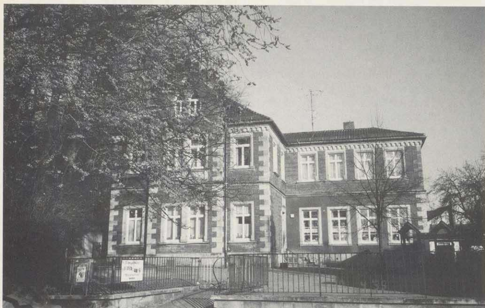
Kindergarten Marienschule in Coburg.