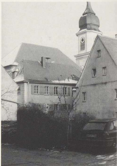
Markgrafenhofkirche mit ehemaligem Schulhaus

In den Jahren 1735/36 ließ Markgraf Carl Wilhelm Friedrich (1712–1757) in Weidenbach eine neue evangelische Hofkirche mit einer Turmhöhe von insgesamt 45 Meter erbauen. Allerdings stand der neu gefundene Standort in eindeutiger Beziehung zu Triesdorf. Der Neubau entstand am damaligen Ortsrand von Weidenbach an der Straße nach