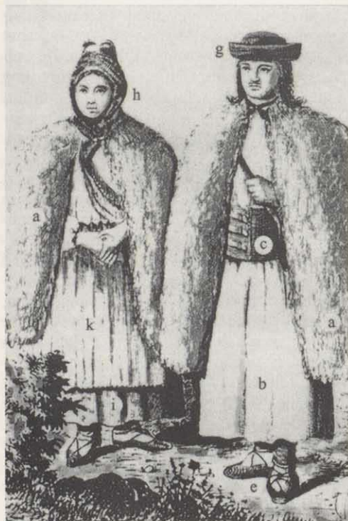
Abb. 1. Festliche Bauertracht der Ruthenen bis ins 20. Jahrhundert (BENEDEK 1993, S.25)

In kalten und nassen Jahreszeiten trugen die Ungarn und Ruthenen, insbesondere die Hirten, einen zottigen Überwurf mit oder ohne Ärmel, der als Unterlage aus grobem Flachsstoff bestand, in dem dicht aneinander Strähnen aus Schaffell eingeflochten wurden. Dieser Überwurf wurde 'Guba < ung. 'guba oder 'Pätäk < ruth. 'petek genannt. Die ungarische 'Guba war meistens aus schwarzem Schaffell (Abb. 2/a), der ruthenische 'Pätäk dagegen aus weißen Schafsträhnen hergestellt (Abb. 1/a). Da diese Wollmantelart schon lange nicht mehr getragen wird, wurden die Benennungen zu Archaismen oder umgedeutet. So bezeichnen die hiesigen Frankendeutschen mit 'Gubi die Weihnachtsspieler (MELIKA 1996, S. 319). Die Entlehnung 'Hunja < ruth. 'hun'a zu tschechisch huňatina „Pelzmantel“ bezeichnete eine Sommerweste, welche die damaligen Ruthenen aus selber gewobenem Wollstoff herstellten. Mit der Zeit hat sich die Bedeutung von 'Hunja