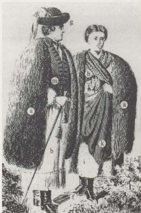
Abb. 2. Festliche Bauertracht der Ungarn bis zum 19. Jahrhundert (BENEDEK 1993, S.22).