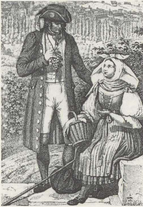
Abb. 3. Festliche Tracht der Franken bei Würzburg bis Mitte des 19. Jahrhunderts. Stich von Fr. Wagner. In: Würzburg Geschichte in Bilddokumenten, Hg. Alfred Wendehorst, Verlag C.H. Beck

( hun'a ) verblasst und gegenwärtig von den älteren Deutschen und Ruthenen synonym zu 'Pätäk gebraucht. Bei den meisten jungen Leuten gerieten diese Wörter in Vergessenheit. Die Ethnorealie 'Gatjä < ung. 'gatya > ruth. 'gat'i bezeichnete eine aus gebleichtem festen Flachsstoff genähte Hose (Abb. 1/b, 2/b), die gelegentlich verziert werden konnten (vgl. Abb. 2/b). Als später die Hosen aus „Zeug“ (Baumwollstoff oder anderer Gewebeat) zu billigem Preis dem Bauer zugänglich wurden, lohnte es sich nicht mehr, die Flachshosen selber zu erzeugen. Die aus Leinengewebe genähte Hose hat sich in Form und Gebrauch geändert, wodurch das Wort 'Gätjä einen Bedeutungswandel erfuhr, indem mit 'gatya die Unterhose bezeichnet wurde, die – nach dem Vorbild der Deutschen – die ruthenischen und ungarischen Bauern, als Unterwäsche, und dann auch ihre Frauen zu tragen begannen. Allgemein gebraucht waren Erzeugnisse aus Schafpelz: der 'Koschuch