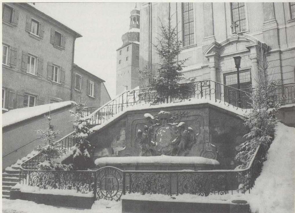
Der Markgrafenbrunnen in Uffenheim

Der Hosenbandorden, (The Most Noble Order of the Garter) wurde 1348 von König Eduard III. als eine adlige Bruderschaft gestiftet, die aus dem König und 25 Rittern bestand; Angehörige des Königshauses und Ausländer gelten als Extraritter. Im Laufe der Zeit sind nicht weniger als 100 Bürgerliche Hosenbandritter geworden. Nicht-Christen können nicht Mitglied des Ordens werden. Es gibt mehrere Erklärungen für die Entstehung des Ordens. Die verbreitetste ist die Anekdote über König Eduard II., der auf einem Hof-