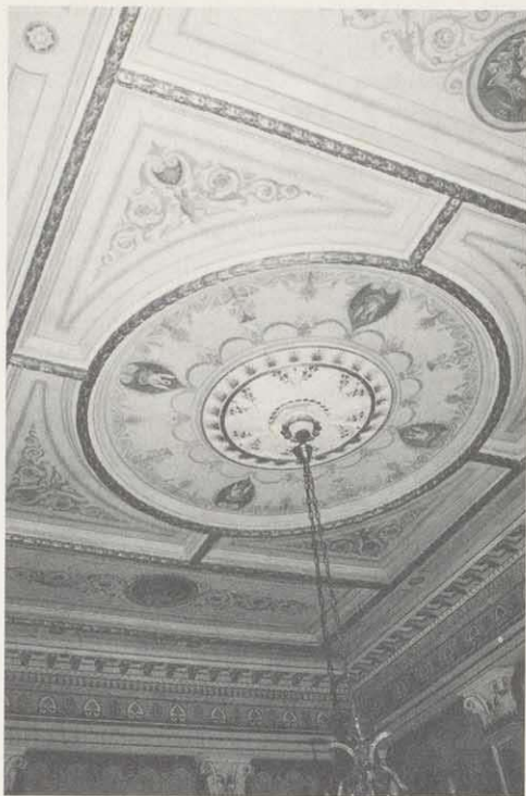
Fürstenzimmer, Bahnhof in Bad Kissingen