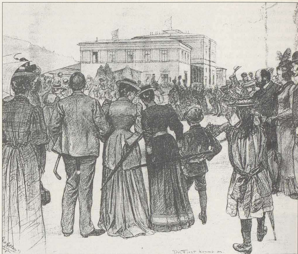
Ankunft des Fürsten Bismarck 1893 am Kissingen Bahnhof.