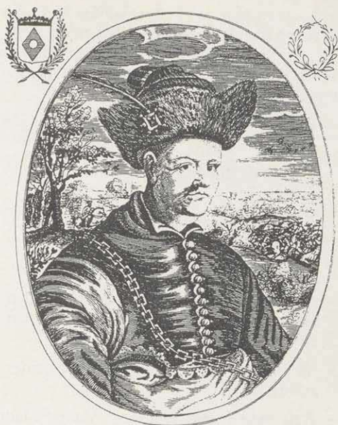
Johann Ludwig Graf von Isolani (1586–1640). Kupferstich 15,5 x 11,5 cm; um 1650.

Nur der Name des Kroatengenerals Goan Lodovico Isolano blieb vorderhand unangestastet. Friedrich Schiller ließ ihn auf 'i' auslauten, und in dieser Form dürfte er Allen bekannt sein, die irgendwann zwischen 1790 und 1970 in der Schule zu spät zum Deutschunterricht gekommen sind: ' Spät kommt ihr,