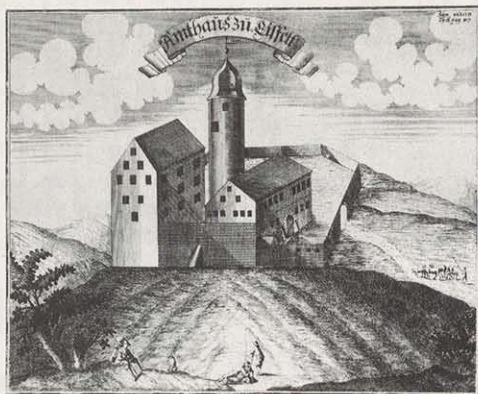
Ansicht des Schlosses zu Eisfeld ohne Küchengebäude u. Marstall aus: Friedrich Rudolphi, Gotha diplomatica.... Frankfurt a. Main und Leipzig 1715–17

sen ein Residenzschloss errichten zu lassen. Die ungünstigen Bedingungen auf der Veste veranlassten den Landesherren, schließlich endgültig nach Hildburghausen überzusiedeln. Eisfeld musste für alle Zeiten auf fürstlichen Glanz in seinen Mauern verzichten. Welche Entwicklung die kleine Stadt hätte nehmen können, zeigt ein Blick auf die Verhältnisse der Nachbarstadt Hildburghausen: die herzogliche Hofhaltung erwies sich dort als ein wichtiger Faktor für das wirtschaftliche und kulturelle Leben, sie veränderte und prägte die gesamte Struktur der einstigen Ackerbürgerstadt.