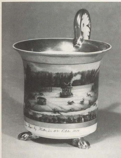
Tasse aus der Porzellanfabrik Schney, 1824 (Kunstsammlungen der Veste Coburg)

und 1 Glasurmüller.“ 8) Koppchen, henkellose Mokkatassen, bestimmt für den Export nach Rußland und in die Türkei, bildeten das Hauptprodukt.