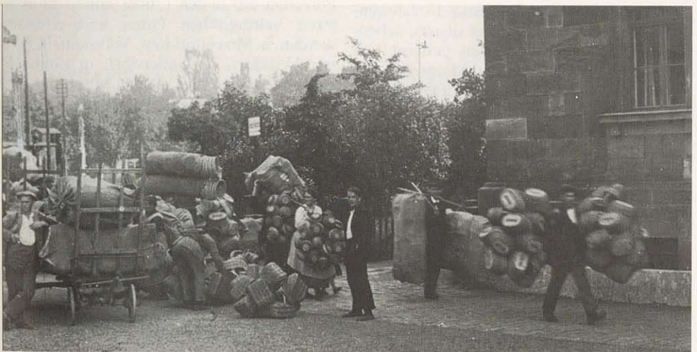
Liefernde Korbmacher in Lichtenfels, frühes 20. Jahrhundert