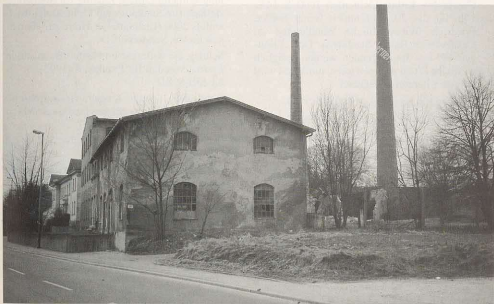
Produktionsgebäude der Porzellanfabrik Schney aus dem späten 19. Jahrhundert (Aufnahme 1990er Jahre, kurz vor dem Abbruch)

Die letzte Lichtenfelser Exportbrauerei ging in den 70er Jahren ein; das gleiche Schicksal erlitten die Weismainer Wurstfabrik, die Malzfabrik Maineck, Möbelfabriken, die ersten Schuhfabriken. Die letzten Schuhfabriken stellten 1990 den Betrieb ein, die Firma Striwa, die noch 1973 ein neues Betriebsgebäude errichtet hatte, baute wenig