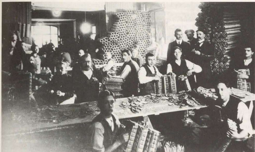
Geschoßkorbfabrik während des Ersten Weltkriegs

eine Porzellanfabrik in Altenkunstadt 24) , eine Uhrenfabrik in Lichtenfels 25) , eine Möbelfabrik in Staffelstein, eine Kofferfabrik in Redwitz. Die meisten dieser Unternehmen bestanden jedoch nicht lange, und auch mancher alteingesessene Betrieb litt, weil man die ausländischen Märkte nur allzu langsam zurückerobern konnte. Absatzkrisen und Hyperinflation taten ein übriges.