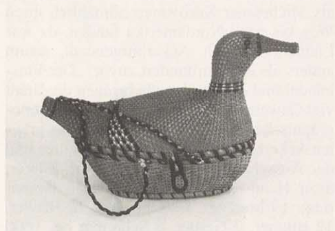
Ente aus Weidenschienen, frühes 19. Jh.

Schläge mit einem Metallstück verdichtet wird. Wohl in den 1780er Jahren bürgerte sich daneben die Feinkorbmacherei ein, die Verarbeitung feinsten Weidenschienen, die man durch Spalten der Rute und durch Hobeln gewann und über Holzformen verflocht. Es entstanden filigrane Körbchen, Zierartikel, modische Accessoires: Fäßchen, Fische oder Enten, die ein Wollknäuel aufnahmen (aus dem Schnabel der Ente kam der Faden), dazu Handtäschchen und Herrenhüte. Bis heute faszinieren diese akkurat geflochtenen Produkte, und sie machten das Angebot aus Michelau, Marktzeuln und anderen Korbmacherorten ringsum unschlagbar.