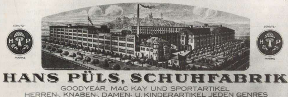
Briefkopf der Schuhfabrik Püls in Burgkunstadt, 1933