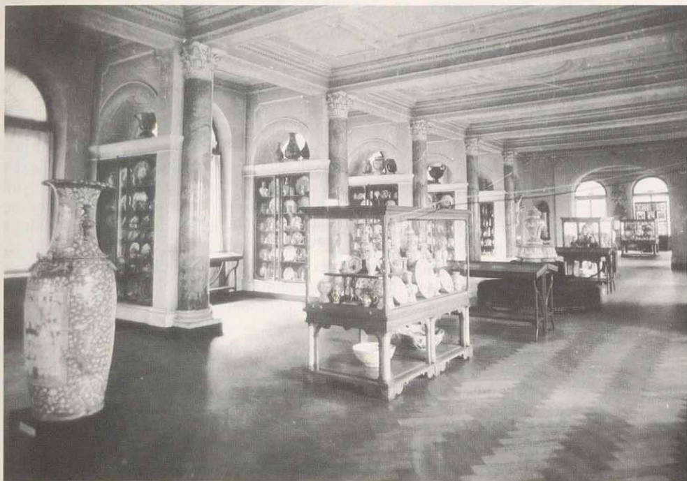
Der Marmorsaal mit kunstgewerblichen Exponaten

räumlichkeiten. Man gab sie deshalb noch vor 1900 an das Deutsche Museum in München ab.