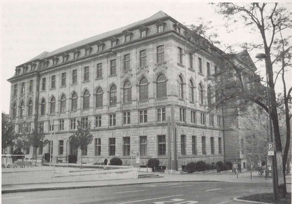
Das Bayerische Gewerbemuseum in Nürnberg heute

Wie und in welcher Weise das Museum konkret seine Arbeit als neue Ausbildungsstätte und Lehranstalt durchführte, erfährt man bei der Durchsicht der seit 1872 jährlich erscheinenden 'Berichte über die Thätigkeit des Bayerischen Gewerbemuseums'. Im Berichtsjahr 1877 beispielsweise betrug die Zahl der Besucher der Mustersammlung 25.434 Personen. Die Vorbildersammlung, bei der es sich um eine Kollektion von heute insgesamt 20.000 Abbildungen verschiedenster Gegenstände in unterschiedlichen Drucktechniken – Kupferstiche, Lithographien, Fotos usw. – handelt, hatte sich ebenfalls um 33 Nummern vergrößert. Neben der ständig wachsenden Mustersammlung, die 1877 um 594 Inventarnummern im kunstgewerblichen und um 96 im technischen Teil vergrößert werden konnte, erfährt man, daß mit den Objekten der Mustersammlung mehrere kleine Wanderausstellungen in Bamberg und