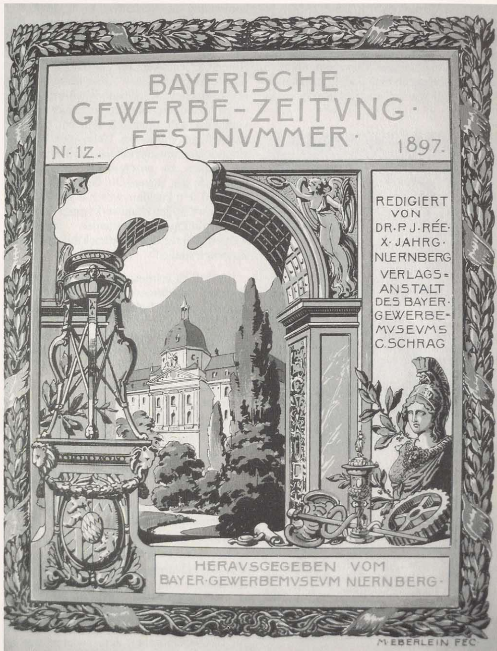
Festnummer der Bayerischen Gewerbezeitung von 1897