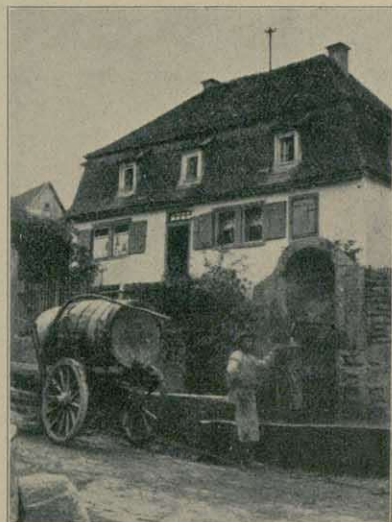
Altes Bürgerhaus und öffentlicher Brunnen in Höchberg (B. u. A. Würzburg)