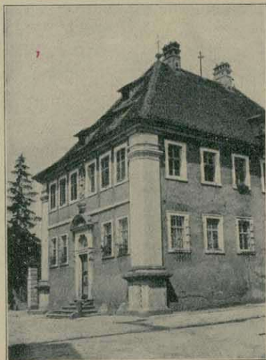
Altes Haus in Friesenhausen (B. u. A. Ochsenfurt)

Momente aufmerksam gemacht und er hat das große Verdienst, daß seine Forderungen von vielen Architekten auch beachtet wurden. Es ist noch nicht gar so lange her, da hielt man nur gradlinige Straßen für schön oder man stellte eine Kirche, ein Rathaus, einen Brunnen, ein Standbild, mitten auf einen großen Platz, oft sogar gerade dorthin nicht, wo die Wirkung am besten gewesen wäre.