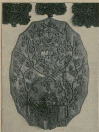
Geschmizter Fahboden im Lutipoldmuseum zu Würzburg.