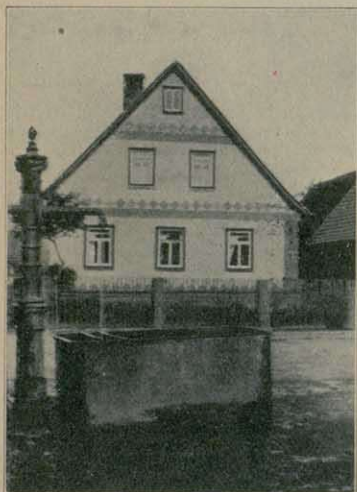
Mit Blechplatten verkleidetes Haus in Sandberg (Rhön).

Dabei waren nur wenige architektonische oder ornamentale Verzierungen angebracht, stets aber an der richtigen Stelle. Eine flott geschnitzte Haustüre, ein Erkerchen, ein Heiligenbild, ein hübsches Korbgitter vor den Fenstern des Untergeschosses, bei Fachwerkbauten an den Eckpfosten oder an einem Fries eine wirkungsvolle Schnitzarbeit mit kräftiger Bemalung, das war Alles schlicht und