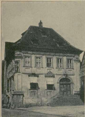
Altes Haus mit Freitreppe in Friesenhausen (B.-A. Ochsenfurt)

Und was für mustergiltige Vorbilder findet man — wenn man nur zu suchen versteht — mitunter an alten Höfchen mit köstlichen Gallerien und an