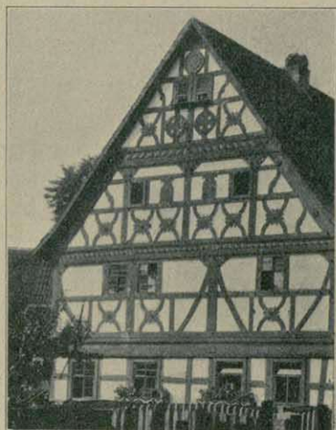
Altes Fachwerkhaus in Oberweihenbrunn (Rhön).

so viele Leute ohne Verständnis und ohne Schönheitsfönn. Viele Baumeister konstruieren das bestellte oder auf Spekulation zu errichtende Haus lediglich und verzieren es vielleicht auch je nach den vorhandenen Geldmitteln; viele Handwerker verschaffen sich Vorbilderwerke und Kataloge, um zu sehen, was augenblicklich in großen Städten Mode ist; und deshalb sind viele Bauten aus der Zeit von 1840 bis 1900, zum Teil auch später, entstandene, so trostlos nüchtern, sind viele Wohnungseinrichtungen so gräßlich, viele Friedhöfe so öde.