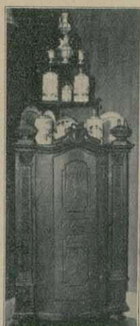
Altes Geschränkchen aus einem Rhön- dorfe (in Privatbesitz).

so wenig wie für manch' anderen Hausrat aus dem 13. bis 18. Jahrhundert. Aber an die heimatliche Bauweise und an die Formengestaltung des Handwerks vom ausgehenden 18. und beginnenden 19. Jahrhundert könnte man sehr wohl anknüpfen und dann unter Anlehnung an solche Vorbilder Neues schaffen.