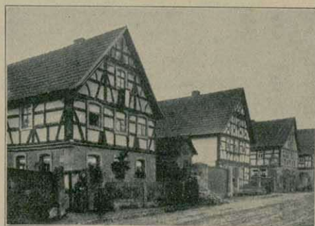
Straße mit alten Fachwerkhäusern in Brendlorenzen (B.-u. Neustadt a. d. E.).

Ein wirkliches Gestalten mit Liebe und feinem Empfinden sieht man nur selten betätigt, jenes Schaffen, bei dem der Zweck auf die einfachste und vollkommendste Weise ausgedrückt erscheint, bei dem auch liebevoll eine gewisse Rücksicht auf Überlieferung und Ortsgebrauch genommen wird, jenes Schaffen, das noch bis etwa 1840 in der Stadt und auf dem Lande etwas ganz Selbstverständliches war, zu welchem aber die Fähigkeit im zweiten Drittel des vorigen Jahrhunderts aus verschiedenen Gründen mehr und mehr verloren gegangen ist.