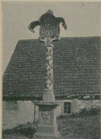
Bildstock mit Weinreben-Ornament in Liefenstockheim (B.-A. Kitzingen)