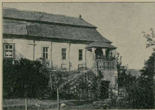
Altes Haus mit schöner Gartenveranda in Ochsenfurt.

Die unbewußten Äußerungen eines feinen Kunstempfindens bei den alten Baumeistern und Handwerkern unseres heutigen Unterfranken bewirkten, daß die alten Bürgerhäuser vom Ende des 18. Jahrhunderts ab einfache und doch fast vornehm wirkende Gebäude waren. Die Verteilung der Fenster, ein Giebel, das Dach, alles erscheint uns so natürlich, so selbstverständlich gestaltet, daß man gar nicht sagen könnte, wie man es besser machen sollte.