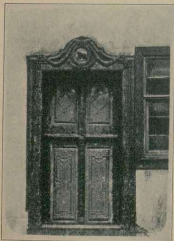
Alte geschnitzte Haustüre in Bischofsheim v. d. Rhön