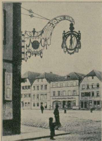
Schmiedeeiserner Gasthauschild u. Träger in Neustadt a. E.

Treppen mit den prächtigsten Holzgeländern. Außerhalb der Städtchen gibt es noch reizende Weinbergs- und Gartenhäuschen aus dem 18. Jahrhundert, oft ganz versteckt, kaum noch von irgend Jemand beachtet.