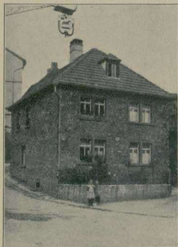
Müchternes unverputztes Haus der Neuzeit in einem unterfränkischen Dorfe.

Vorn gußeiserne Brunnensäule mit korinthischem Kapitäl.