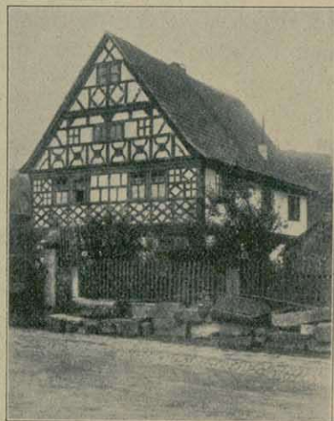
Altes Fachwerkhaus in Oberbach (Rhön).