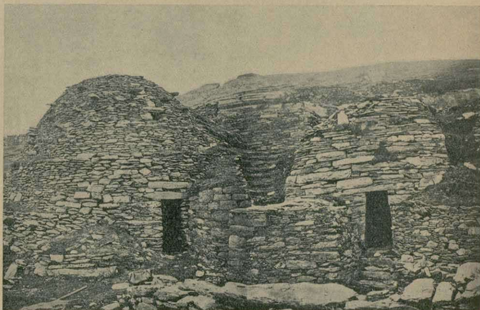
Klaufnerzellen (künstliche Höhlen) von St. Michaels Kells, Graffschaft Kerry, Irland.

Die Bewohner von Kells nennen diesen Bau St. Kolumbans oratory. Es ist das Klösterlein, aus welchem so mancher Glaubensbote für das Festland hervorgegangen ist. Auch St. Kilian und St. Marian stammen von da. St. Kilian bezeugt es mit seinem Namen, der eigentlich Kyllena, d. h. der von Kells, der Kelfer, lautete. Auf einer Grundfläche von etwa 7 zu 5 Metern erheben sich Umfassungsmauern von 3 bis 3\frac{1}{2} Meter Höhe. Tritt man durch eine schmale Lücke ins Innere des Raumes, so erscheint dieser im Verhältnis zu den Außenmaßen sehr klein. Er ist durch die