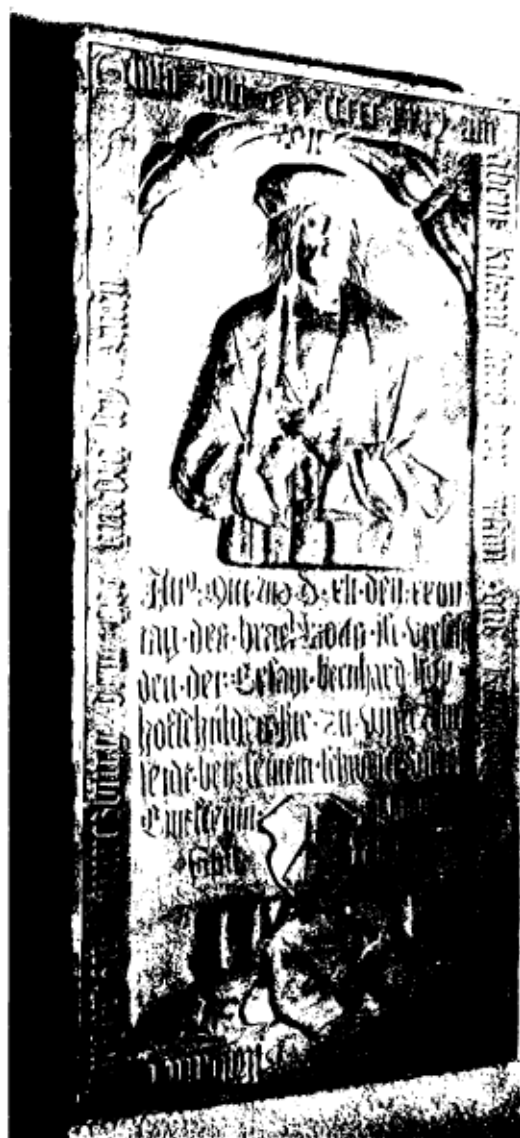
Grabplatte Tilmann Riemenschneider aus dem Riemenschneider-Gedächtnissaal des Fränkischen Luitpoldmuseums